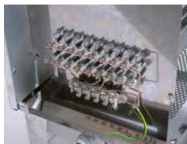
Внутреннее исполнение печей SAUNA-therm.