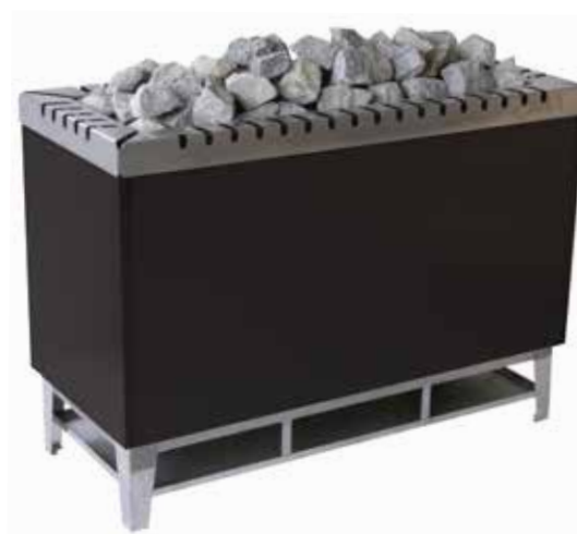
Тип 104 Мощность 32-36 кВт