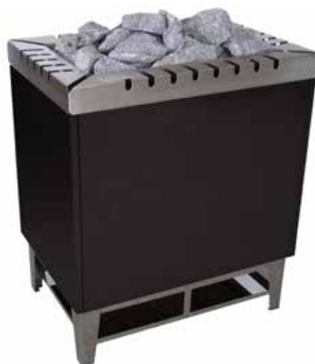
Тип 64 Мощность 18-21 кВт.