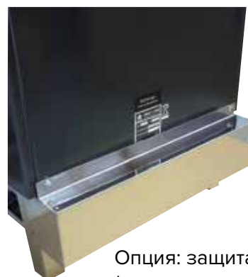
Опция: защита кабеля (монтируется на задней стенке).