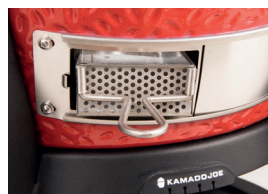
Запатентованный зольный ящик