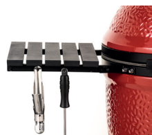
Алюминиевые боковые полки