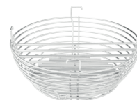
Корзина для угля