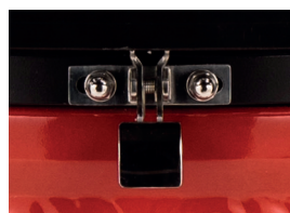
Замок из нержавеющей стали