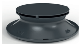
Запатентованная система "Циклон"