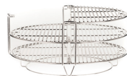
Система Divide & Conquer®